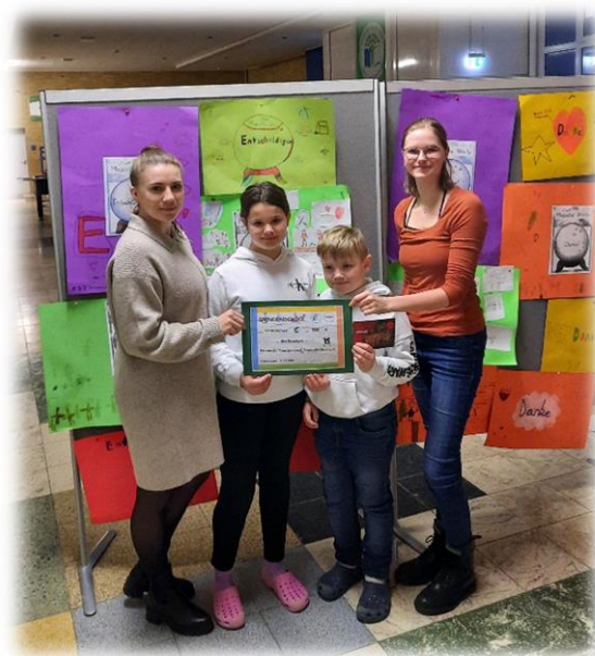
Spendenübergabe an Bikonelli